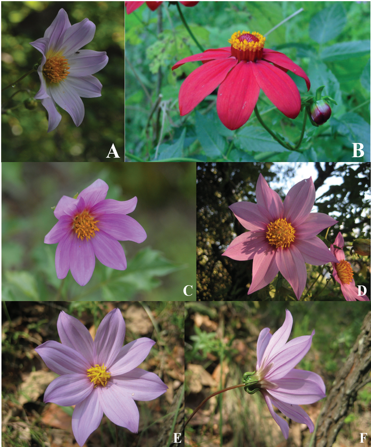
Figura 1. Las dalias del estado de Jalisco. A, Dahlia barkerae ; B, D. coccinea ; C, D. sherffii ; D, D. tenuicaulis ; E, D. pugana , vista frontal de la cabezuela; F, D. pugana , vista lateral y posición de las filarias.