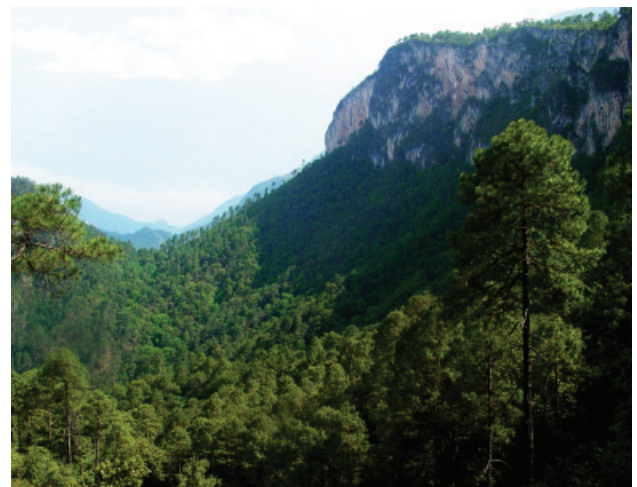
Figura 4. Vista del área 2, con una extensión de 5.13 hectáreas.

m 2 , las estimaciones más conservadoras muestran que al extrapolar los datos de los 2 núcleos poblacionales, pueden llegar a encontrarse más de 1 000 individuos.