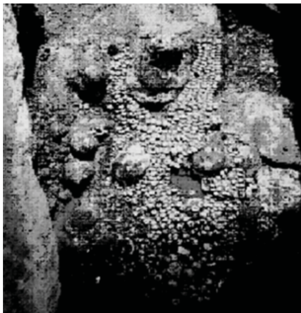
Figura 4. Fondo de la ofrenda 107.

Tomando en cuenta su hábitat, posiblemente algunas especies en buen estado de conservación se obtuvieron mediante buceo, como Spondylus calcifer , de la cual se identificaron las 2 valvas de un mismo ejemplar de gran tamaño, y 13 ejemplares de Chama echinata .