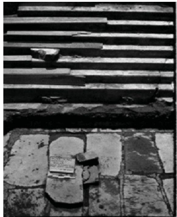
Figura 3. Ofrenda 107 tapada con el sillar de la VI etapa (1502-1521).