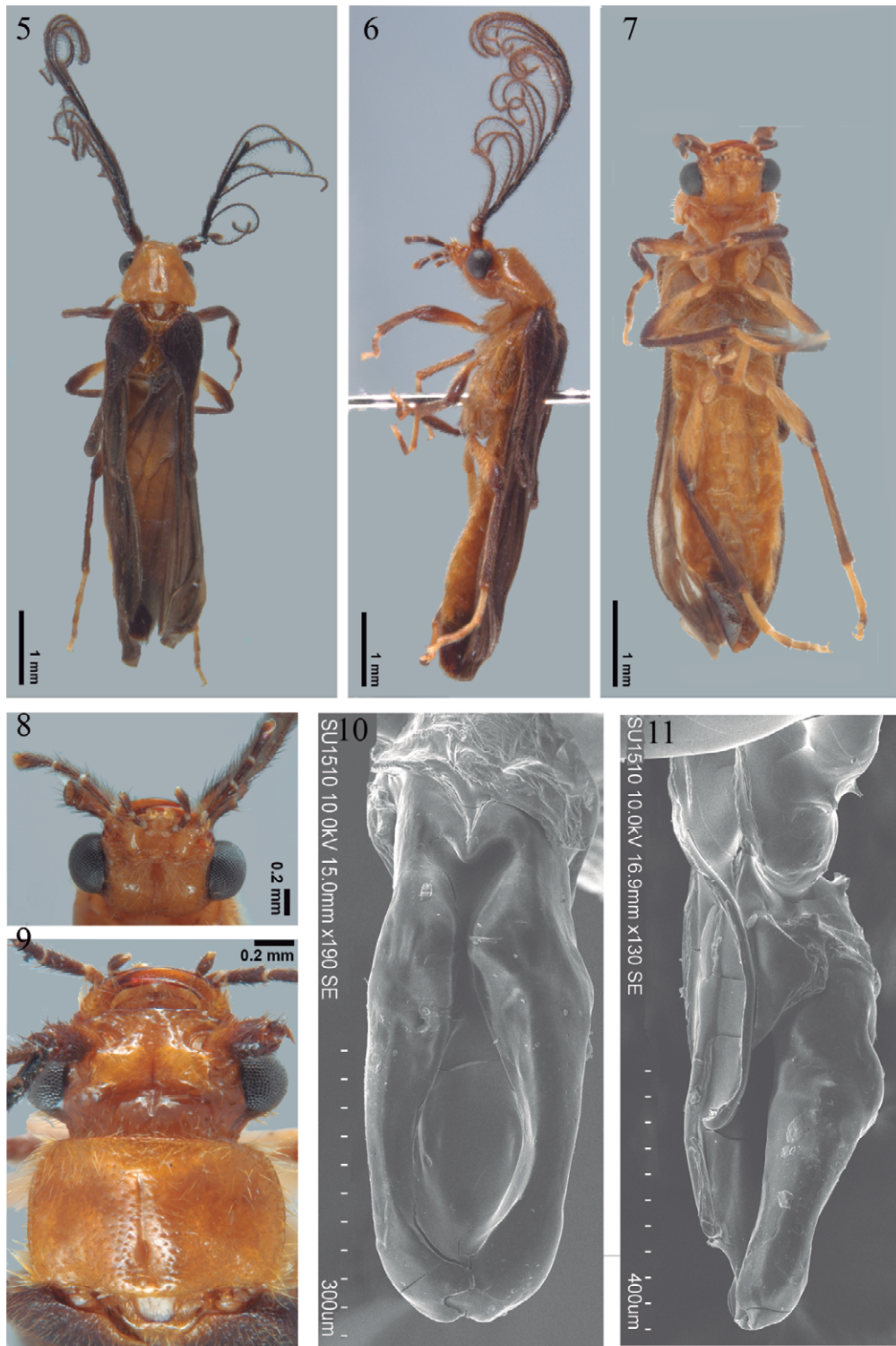
Figuras 5-11. Phengodes (Phengodella) kuukum sp. nov. 5-7 Vista dorsal, lateral y ventral; 8, vista ventral de la cabeza; 9, vista dorsal de la cabeza y pronoto; 10-11, vista dorsal y lateral del aparato reproductor masculino.