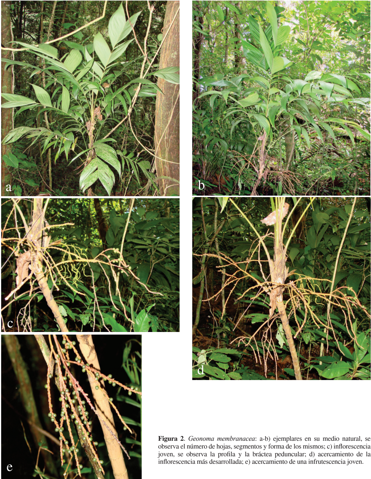
Figura 2. Geonoma membranacea : a-b) ejemplares en su medio natural, se observa el número de hojas, segmentos y forma de los mismos; c) inflorescencia joven, se observa la profila y la bráctea peduncular; d) acercamiento de la inflorescencia más desarrollada; e) acercamiento de una infrutescencia joven.