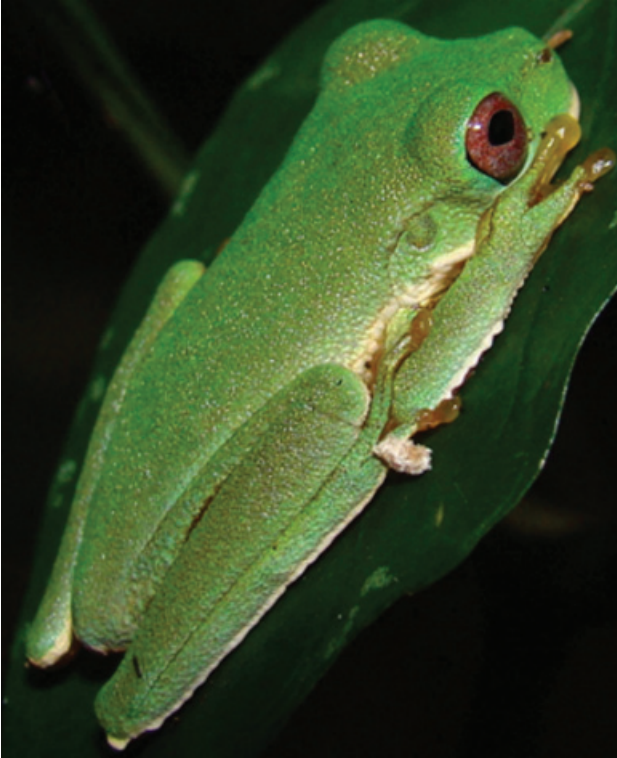
Figura 1. Ejemplar en vida de Duellmanohyla chamulae recolectado en la región de Uxpanapa, Veracruz, México (MZFC 22841).

de aproximadamente 170 km hacia el oeste, en línea recta desde la localidad más cercana de la distribución geográfica conocida (Fig. 2), un nuevo límite altitudinal inferior (120 m menos que el previamente conocido) así como el primer registro de ésta especie en el estado de Veracruz.