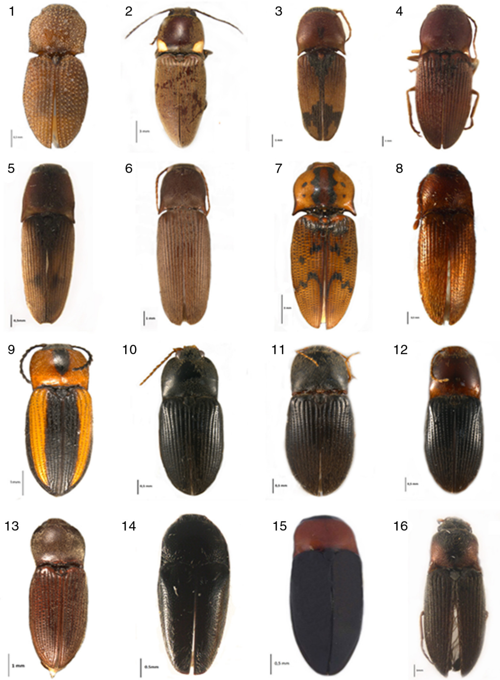
Figura 1. Hábito dorsal de las especies que representan nuevos registros para Jalisco. 1, Rismethus scobinula Candèze, 1857; 2, Vesperelater occidentalis Champion, 1895; 3, Aeolus melliculus Candèze, 1859; 4, Conoderus pruinosus Champion, 1895; 5, C. rodriguezii Candèze, 1881; 6, C. depressipennis Candèze, 1859; 7, C. nocturnus Candèze, 1859; 8, Heteroderes gibbulus Champion, 1895; 9, Cardiophorus aptopoides Candèze, 1865; 10, Esthesopus hepaticus Eschscholtz, 1829; 11, E. brevisculus Champion, 1896; 12, E. atripennis Candèze, 1860; 13, Horistonotus mixtus Champion, 1895; 14, Drapetes sp.; 15, Lissomus sp.; 16, Agriotes mixtus Champion, 1896.

en mayor número de especies es Agrypninae con 16 especies, seguida por Cardiophorinae con 6, Cebrioninae y Lissominae con 2, y Semiotinae y Thylacosterninae con una. Cinco registros de especies son nuevos para el territorio mexicano: Lacon pollinaria (Candèze, 1857), Aeolus bimucronatus Champion, 1895, Conoderus athoides (LeConte, 1863), Scaptolenus fulvus Chevrolat, 1874, Anchastus seminiger Champion, 1895, Dipropus atricornis (Champion, 1895), Megapenthes bicarinatus Lewis,