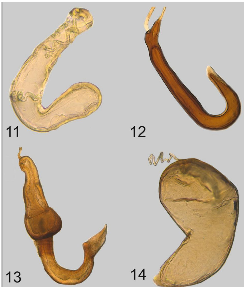
Figuras 11-14 capsulas espermáticas de distintas hembras de Cassidinae. 12) Trichaspis pilasula (Boh.), 13) Chiridopsis aubei (Boh.), 14) Glyphocasis lepida (Spaeth), 15) Hybosinota nodulosa (Boh.).