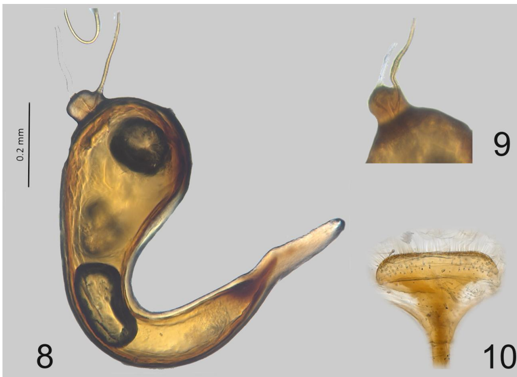
Figuras 8-10, genitalia femenina. 9) cápsula espermática. 10) ramus . 11) esternito VIII.