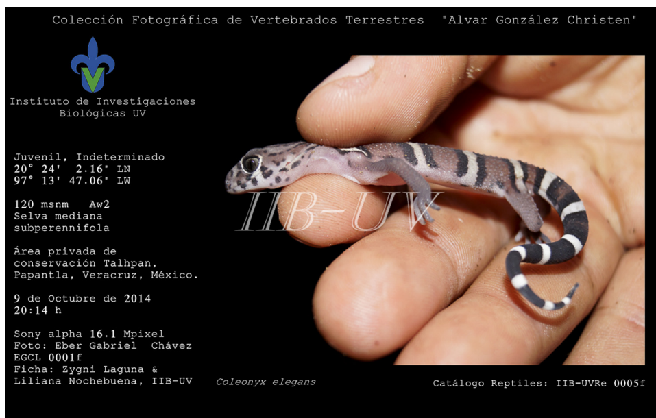
Figura 2. Ejemplar de Coleonyx elegans (catálogo reptiles: IIB-UVre 0005f) registrado en el área privada de conservación Talhpan, Papantla, Veracruz, México.