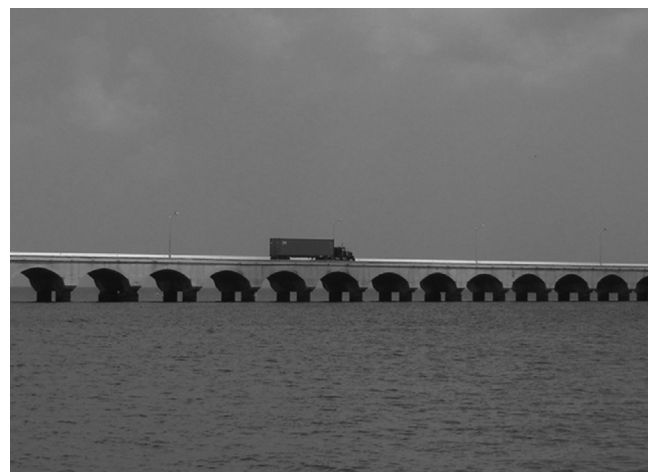
Figura 2. Viaducto-muelle del recinto portuario API-Progresso, Yucatán.

1988) (CNCR 28760); Lembos websteri Bate, 1857 (CNCR 28761); Plesiolembos ovalipes (Myers, 1979) (CNCR 28762); Plesiolembos rectangulatus (Myers, 1977) (CNCR 28763); superfamilia Corophioidea Leach, 1814; familia Ampithoidae