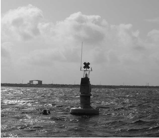
Figura 3. Boyas guía de acceso al recinto portuario API-Progreso, Yucatán.

Boeck, 1871; Ampithoe longimana Smith, 1873 (CNCR 28764); A. marcuzzii Ruffo, 1954 (CNCR 28765); A. ramondi Audouin, 1826 (CNCR 28766); familia Corophiidae Leach, 1814; Laticorophium baconi (Shoemaker, 1934) (CNCR 28767); Monocorophium acherusicum (Costa, 1853) (CNCR 28768); Monocorophium sp.; infraorden Caprellida Leach, 1814; superfamilia Caprelloidea Leach, 1814; familia Caprellidae Leach, 1814; subfamilia Caprellinae Leach, 1814; Caprella equilibra Say, 1818 (CNCR 28769); C. penantis Leach, 1814 (CNCR 28770); Paracaprella pusilla Mayer, 1890 (CNCR 28771); superfamilia Isaeoidea Dana, 1852; familia Isaeidae Dana, 1852; Photis longicaudata (Bate y Westwood, 1862) (CNCR 28772); Photis sp.; superfamilia Photoidea Boeck, 1871; familia Ischyroceridae Stebbing, 1899; Erichthonius punctatus (Bate, 1857) (CNCR 28774).