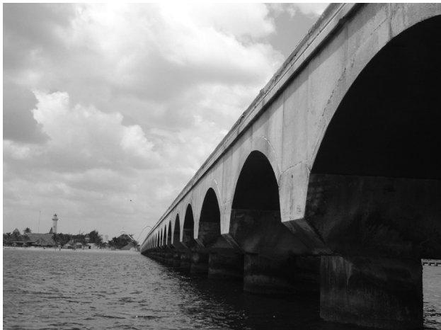
Figura 4. Pilotes del viaducto-muelle del recinto portuario API-Progreso, Yucatán.

Suborden Gammaridea Latreille, 1803; familia Ampeliscidae Costa, 1857; Ampelisca schellenbergi Shoemaker, 1933 (CNCR 28775); familia Colomastigidae Stebbing, 1899; Colomastix