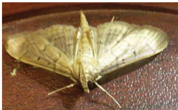
Figura 3. Adulto de Herpetogramma bipunctalis obtenido en laboratorio.

en el trabajo de Allyson (1984). La etapa de crisálida tuvo una duración de 10-11 días (22-31/10/2012), luego llegó a la etapa de adulto (Fig. 3), con la cual se corroboró la determinación taxonómica de H. bipunctalis , utilizando las claves del género para Norteamérica (Solis, 2010).