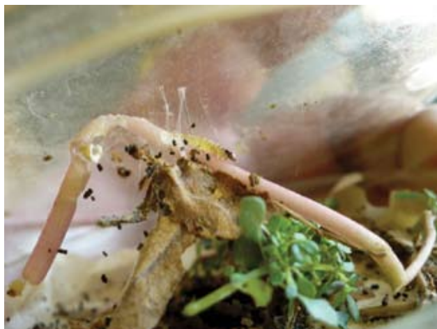
Figura 2. Larvas de Herpetogramma bipunctalis alimentándose de Alternanthera philoxeroides .