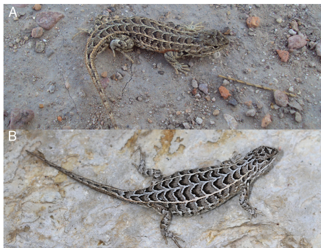
Figura 2. Vista dorsal de ejemplar macho (A) y hembra (B) de Sceloporus goldmani .

encontró diferencia significativa entre sexos al comparar la L.H.C. ( Z = -0.80 , p > 0.05 ; hembras = 11, machos = 10), la L.T. ( Z = -1.67 , p > 0.05 ; hembras = 09, machos = 10), el peso ( Z = -0.73 , p > 0.05 ; hembras = 11, machos = 10) y el número de poros femorales ( Z = 0.0 , p > 0.05 ; hembras = 11, machos = 10). Se encontró diferencia significativa entre sexos al comparar el número de escamas dorsales ( Z = 2.46 , p < 0.05 ; hembras = 11, machos = 10) y escamas ventrales ( Z = 1.97 , p < 0.05 ; hembras = 11, machos = 10), teniendo las hembras un mayor promedio en ambos casos. Las nuevas localidades de S. goldmani reportadas aquí se encuentran entre los 2,100–2,506 m snm y corresponden a planicies cubiertas de pastizal ( Bouteloua spp.) con encinos dispersos ( Quercus potosina ), izotales ( Yucca filifera ), agaves ( Agave lechuguilla , A. salmiana ), nopaleras ( Opuntia streptacantha ), mimosas ( Mimosa monacistra ), huizaches ( Acacia shaffneri ), biznagas ( Ferocactus histrix , Mammillaria uncinata , Stenocactus multicostatus ), jarillas ( Dodonaea viscosa ) y sotoles ( Dasyllirion acrotrichum ). Además, cabe mencionar que el ejemplar encontrado en la localidad al oeste de Los Encinitos, Pinos, Zacatecas, representa el registro de mayor altitud para la especie con 2,506 m.