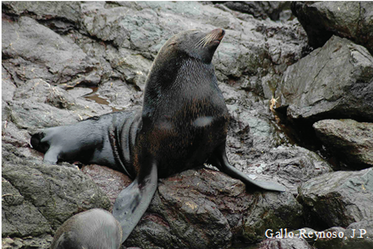
Figura 1. Macho adulto de lobo fino de Guadalupe en la isla del Oeste del archipiélago de San Benito.

comercial por su piel, fue casi exterminado durante ese periodo. Se estima que entre 1700 y 1848, al menos 52 000 lobos finos fueron cazados en islas del Pacífico de México y de Estados Unidos de América (Weber et al., 2004), y para 1894 se declaró comercialmente extinto (Townsend, 1931). Fue redescubierto en 1954 con el avistamiento de 14 individuos en isla Guadalupe (Hubbs, 1956; Peterson et al., 1968; Gerber y Hilborn, 2001).