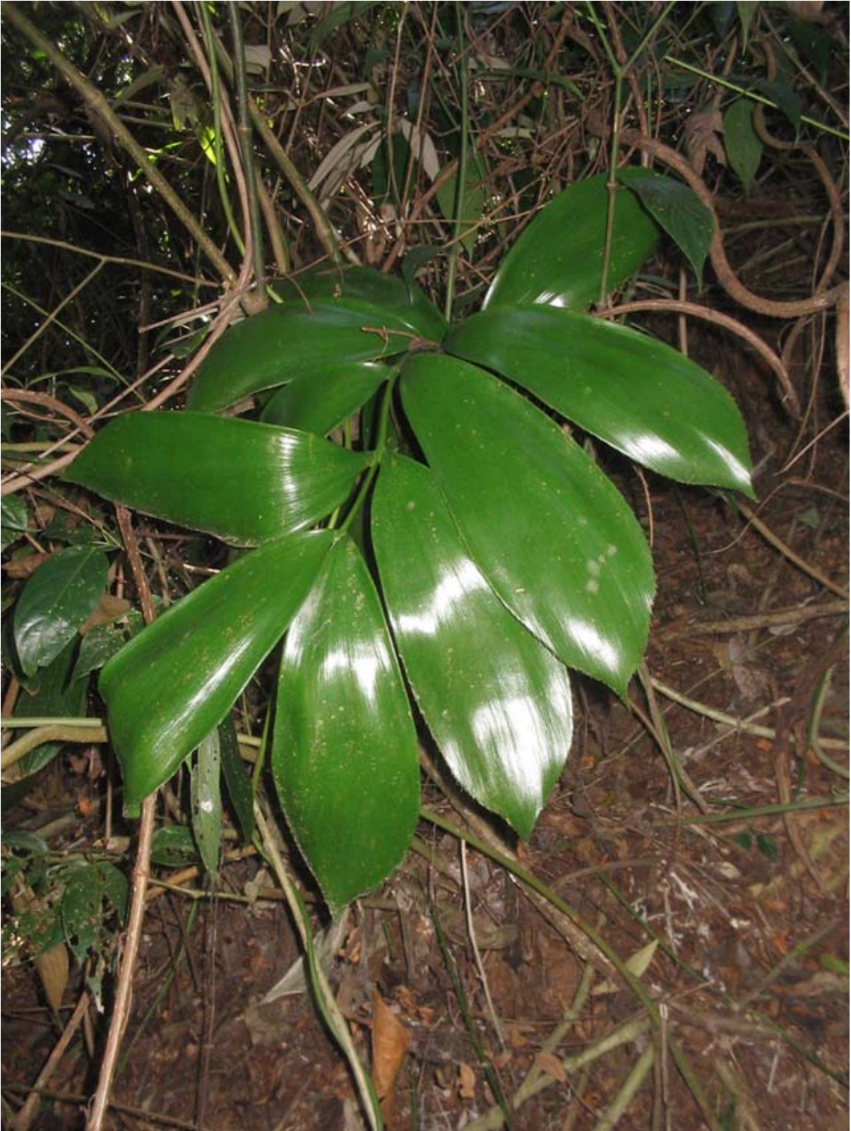
Figura 2. Zamia katzneriana (Regel) E. Retting.