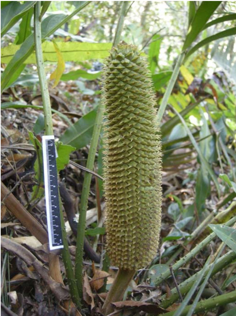
Figura 3. Ceratozamia mexicana Brongn.

animales, por ejemplo curculiónidos— aunque en ocasiones puede ser anemófila. La polinización y la fertilización están bien separadas en las cicadas, pudiendo transcurrir entre 3 y 7 meses entre los 2 eventos. La presencia de espermatozoides móviles es una apomorfia de las cicadas; estos gametos se producen en el tubo polínico después de la germinación post-polinización.