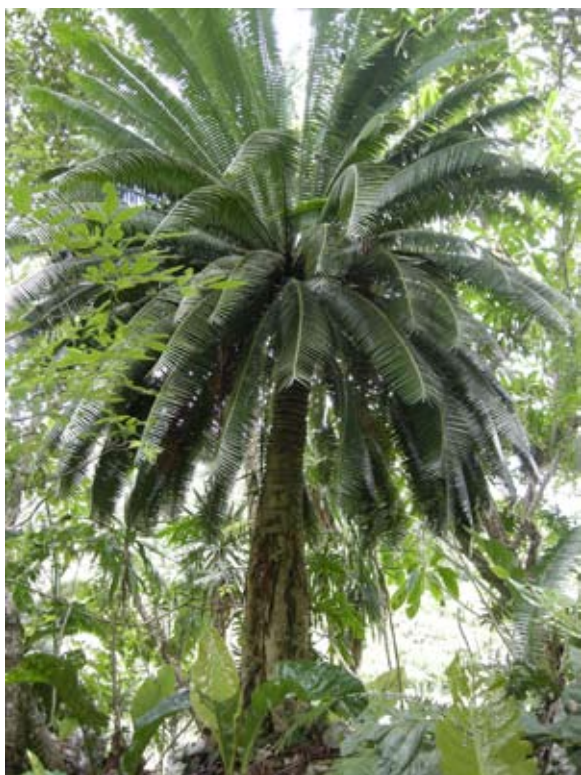
Figura 1. Dioon spinulosum Dyer ex Eichler.

Descripción morfológica. Las cícadas presentan tallos arborescentes (Fig. 1) o subterráneos. Algunas especies de cícadas arborescentes en el género Lepidozamia pueden alcanzar los 15 m de alto; en contraste, las especies de talla pequeña y tallos de hábito subterráneo, como es el caso de algunas especies de Zamia , tienen hojas que rondan los 20 cm de largo. Aquellos taxa con crecimiento arborescente suelen estar cubiertos por bases foliares persistentes y por catáfilas, mientras que los géneros subterráneos pueden conservar dichas estructuras (por ejemplo, Cycas , Encephalartos y algunas especies de Macrozamia ) o carecer de ellas (por ejemplo, Bowenia , Stangeria , Zamia ). La dioecia, la formación de estructuras reproductivas, estróbilos y conos, masculinas o femeninas