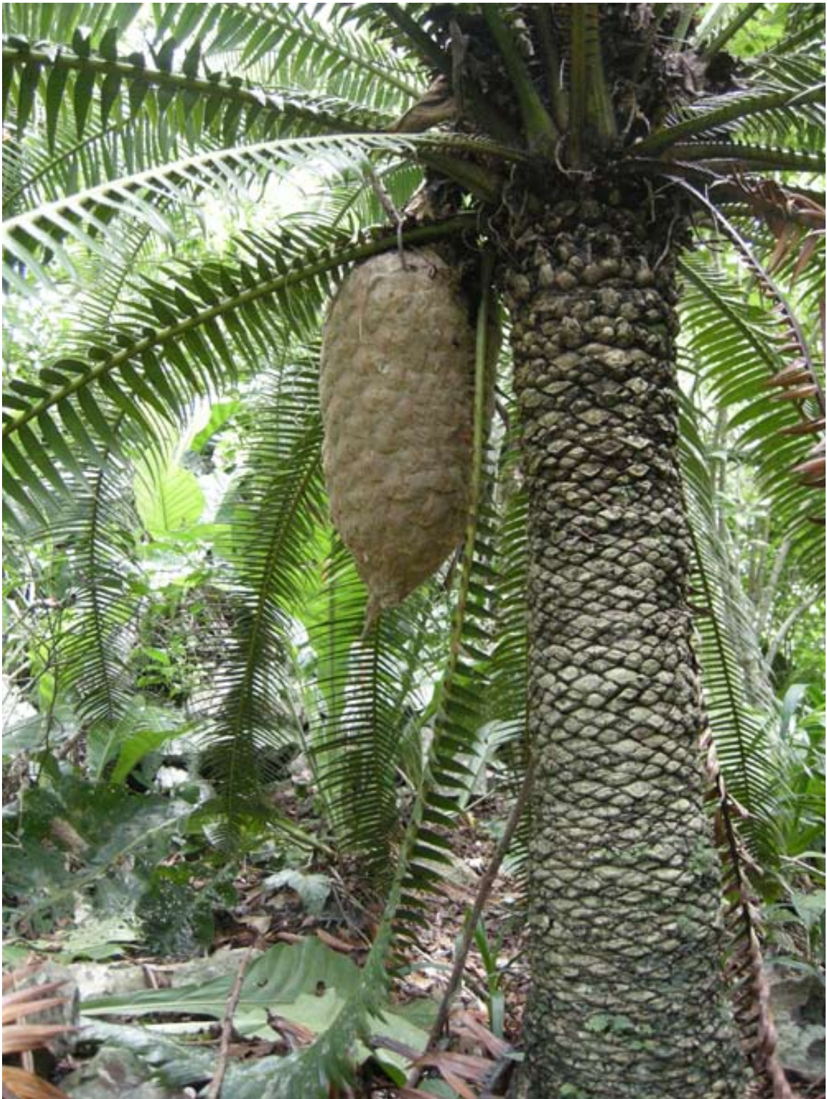
Figura 4. Dioon spinulosum Dyer ex Eichler.