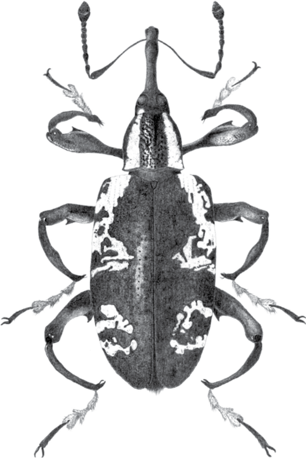
Figura 1. Heilipus albopictus (Champion, 1902) (Curculionidae: Molytinae), vista dorsal.