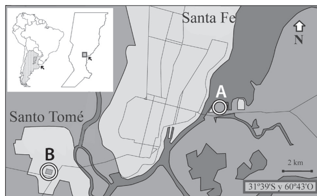
Figura 1. Ubicación de los sitios de muestreo. A, Reserva de la Universidad Nacional del Litoral dentro del valle aluvial del río Paraná, y B, terreno baldío dentro del ejido urbano de la ciudad de Santo Tomé.

Análisis numérico y estadístico. Para relacionar el tamaño (LHC) y peso (P) de los ejemplares con el número (N) y volumen (V) de las presas ingeridas se utilizaron correlaciones de Spearman, debido al incumplimiento del requisito de normalidad requerido para la utilización de análisis paramétricos. Para calcular la diversidad trófica se usó el método propuesto por Pielou (1969): 1 - D = 1 - [(\sum_{i=1}^S n_i (n_i - 1)) / (N (N - 1))] ; donde S es el número de especies (i.e., presa), N es el total de organismos presentes y n es el número de ejemplares por especie (i.e., presa). Se calculó la diversidad media (H) y la diversidad trófica acumulada (Hk) que permite determinar la muestra mínima,