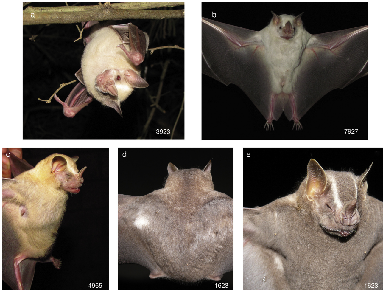
Figura 1. Artibeus lituratus : a) número 3,923, CF albino; b) número 7,927, CF manchas blancas; c) número 4,965, CF descolorido; d-e) número 1,623, CF manchas blancas, se observan en el dorso de la escápula izquierda (d) y en la parte ventral cerca a la axila derecha (e).

segundo ejemplar (número de campo 7,927) fue una hembra adulta inactiva capturada en bosque espinoso con remanentes de selva mediana subcaducifolia (29 de noviembre de 2012 a las 3:00 h). El antebrazo midió 65.6 mm y pesó 51 g. Se agrupó en la CF manchas blancas, porque el pelo de la cabeza y del cuerpo fue de color blanco, la hoja nasal y la base de las orejas de color claro, mientras que las membranas alares, el uropatagio y los ojos de color normal (fig. 1b). El tercer ejemplar (número de campo 4,965) fue una hembra adulta en lactancia que se capturó en bosque espinoso con remanentes de selva mediana subcaducifolia el 7 de julio de 2011 a las 22:00 h. El antebrazo midió 68.2 mm y pesó 51 g. Se asignó a la CF descolorido, porque el pelo de la cabeza y del cuerpo fue de color amarillo claro en lugar de gris o café negruzco, la hoja nasal rosa, mientras que los ojos, las orejas, las membranas alares y el uropatagio fueron de color café (fig. 1c). El cuarto murciélago (número de campo 1,623) se capturó en Jalisco, municipio de Puerto Vallarta, Área Natural Protegida Estero El Salado, sitio El Vivero, 20°40'32.76" N, -105°13'58.70" O, 85 m snm; fue una hembra adulta inactiva con un antebrazo de 69.0 mm que se capturó el 4 de octubre de 2008 a las 24:00 h en bosque espinoso con palmeras de coco ( Cocos nucifera ). Tuvo una mancha blanca en el dorso próxima al inicio del ala izquierda (fig. 1d),