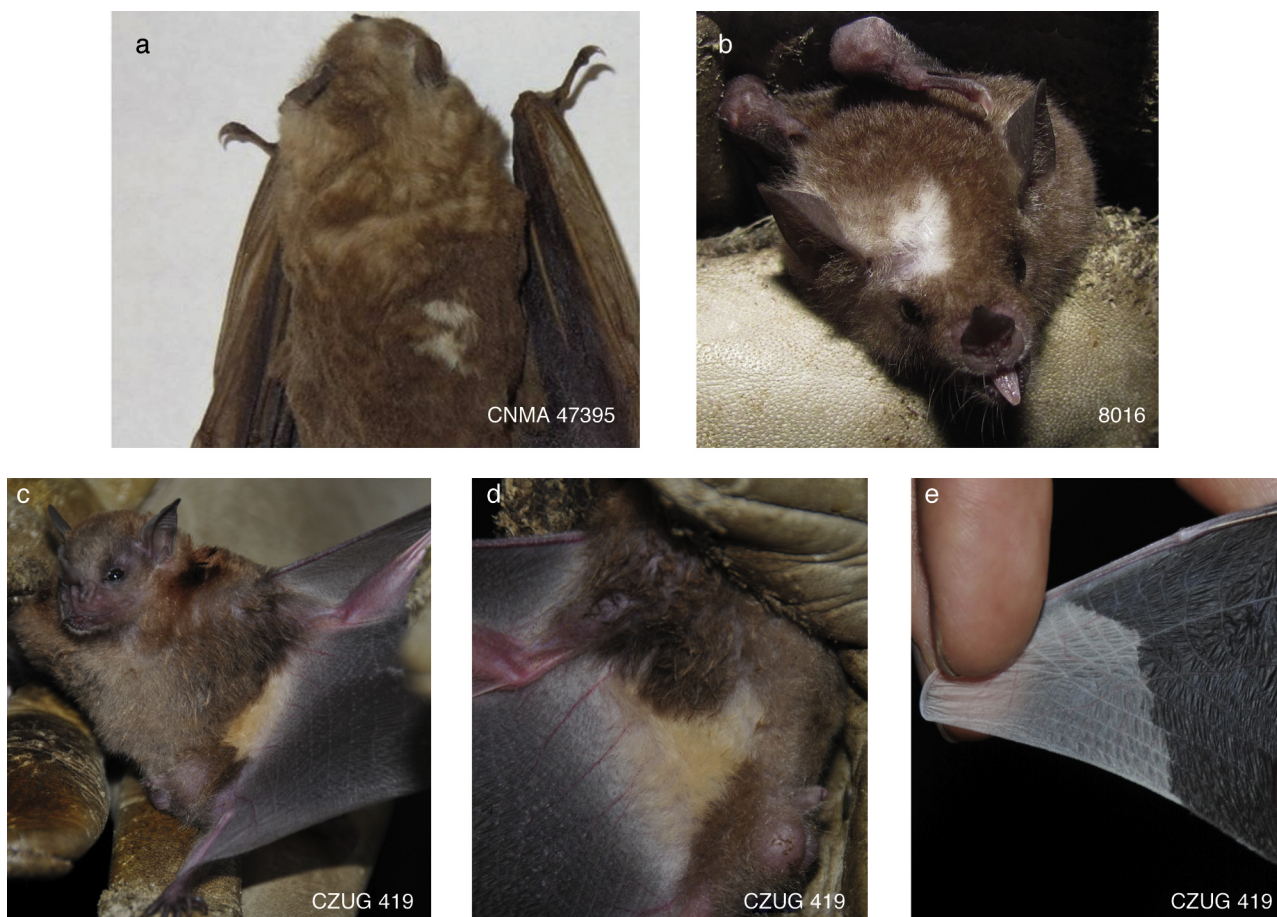
Figura 2. a) Artibeus lituratus (CNMA 47395), CF manchas blancas; b) G. soricina (8016), CF manchas blancas; c-e) Sturnira parvidens (CZUG 419), CF combinada manchas blancas-descolorido, el pelo de los costados de lado ventral es amarillo (c, d) y las puntas de las 2 alas son blancas (e).

Juchitán de Zaragoza, La Venta, 16°36'30.88" N, -94°47'21.70" O, 25 m snm, en selva baja caducifolia, el 21 de abril de 2011 a las 22:15 h. El antebrazo midió 39.2 mm y pesó 19.5 g. Se asignó a una CF combinada manchas blancas-descolorido, porque el pelo de los costados (fig. 2c) del lado ventral (fig. 2d) fue amarillo (CF descolorido), el resto del cuerpo y las membranas alares de color normal, pero las puntas de las 2 alas fueron de color blanco (CF manchas blancas; fig. 2e).